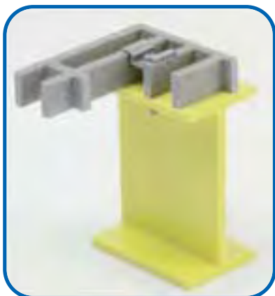
KLIPPS TYP D30/7 UND D30/9

Die Montage und Befestigung erfolgt ausschließlich mit Edelstahlzubehöre AISI 316. Je nach besonderen Bedürfnissen, liefert die ProMetall Klips in verschiedenen Formen und Größen.