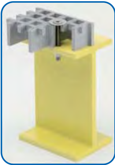
KLIPPS TYP 19T7 UND 19T9

Benutzbar mit folgenden Gitterrosten: SCH 40/28 SCH 38/25 SCH 38/38 SCH 40/38 SCH 38/30