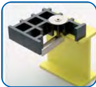
KLIPP TYP TS9

geeignet für alle Gitterrosttypen, besonders die mit geschlossener Oberfläche, ausgenommen die Mikromaschen.