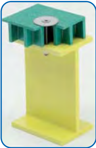
KLIPPS TYP T7 UND T9