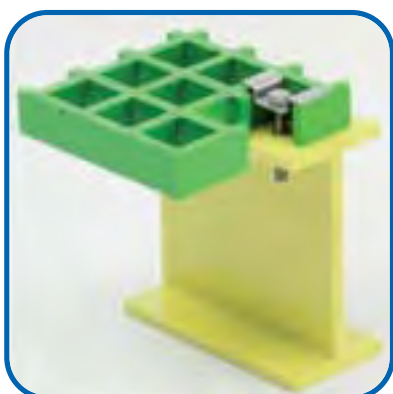
KLIPPS TYP D40/7 UND D40/9

Benutzbar mit folgenden Gitterrosten: SCH 30/28 SCH 50/28 SCH 30/38 SCH 50/38