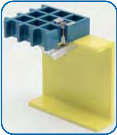
KLIPP TYP DS40/9